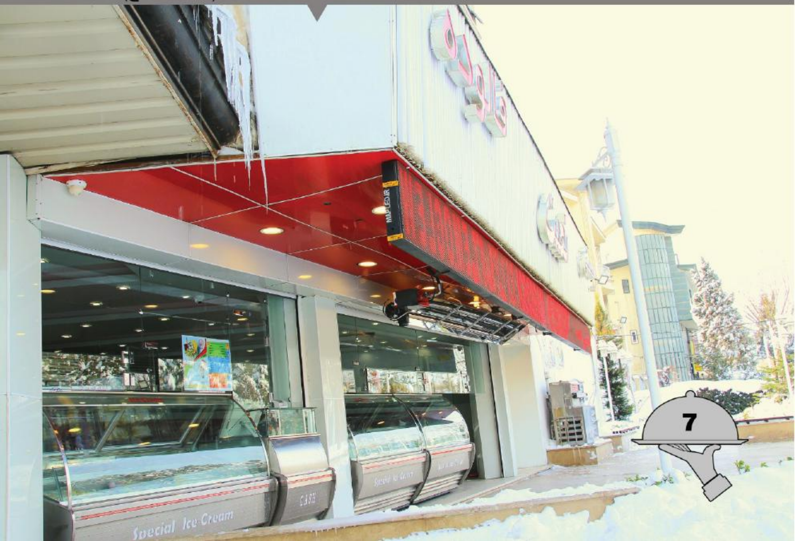
بستنی نعمت (مهر شهر کراچ)