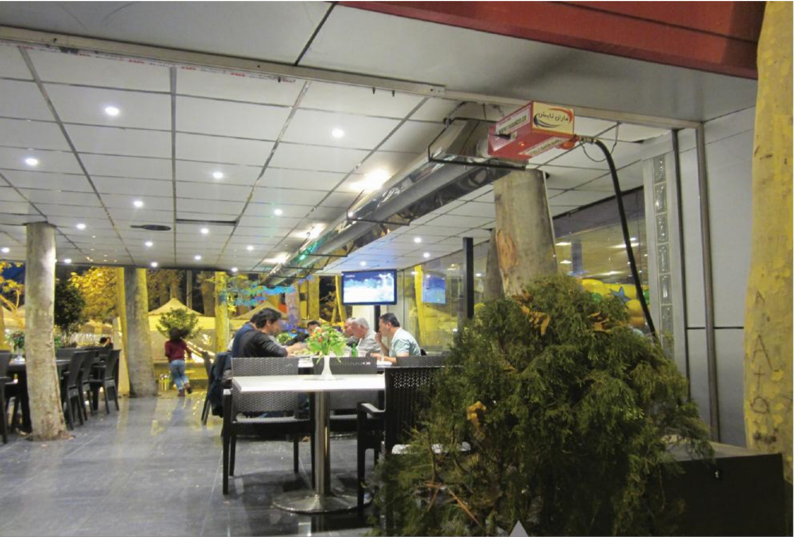
رستوران ارکیده (جاده چالوس)