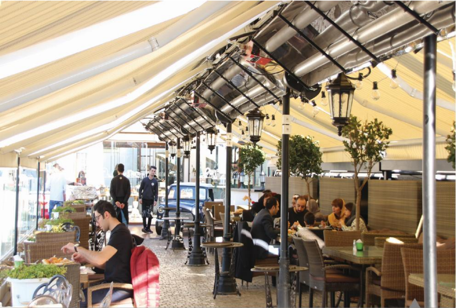
کافه شمرون (بام لند تهران)