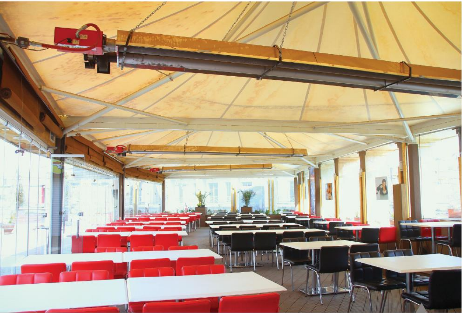
فود کورت ارگ (فردیس کرج)