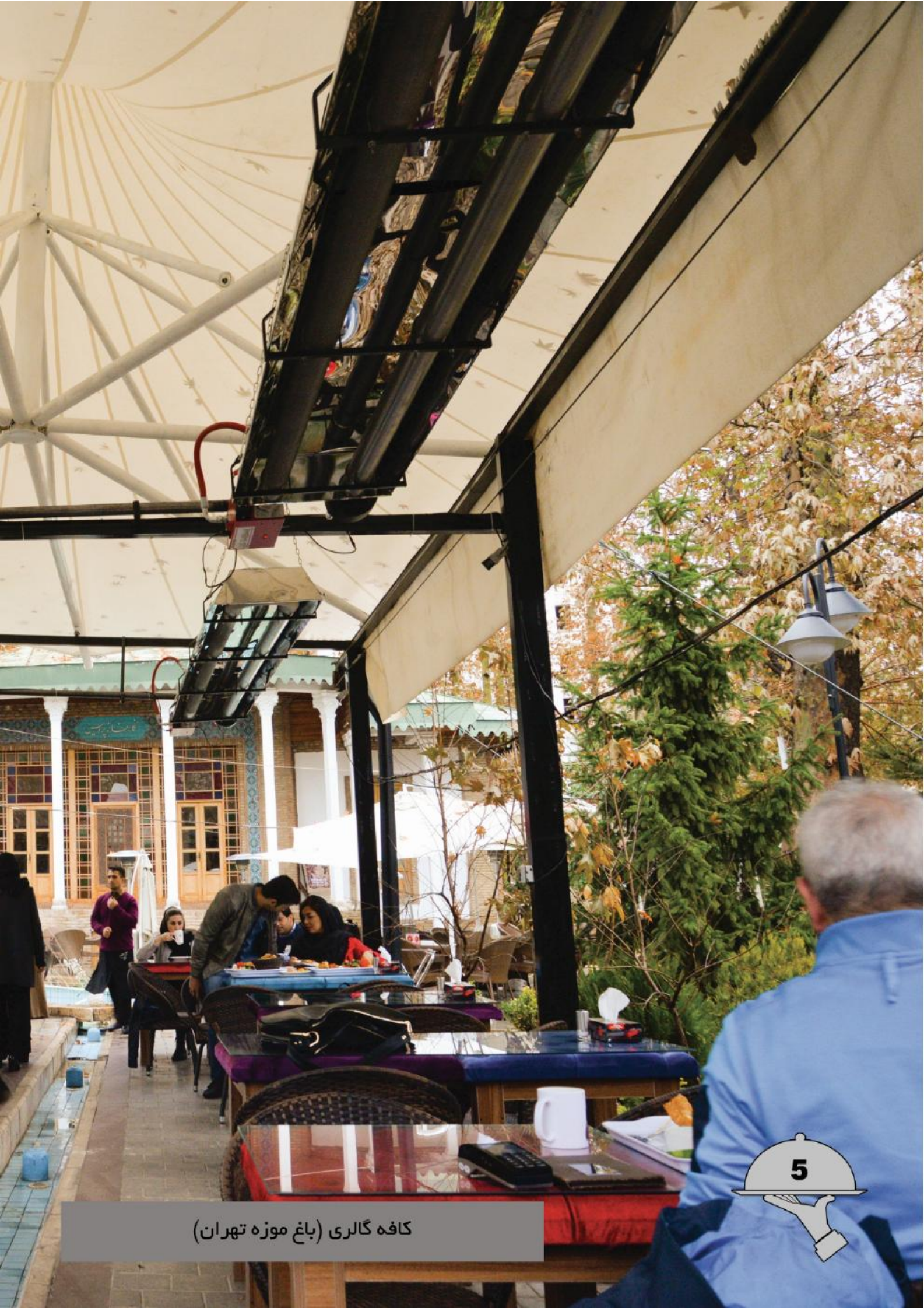
کافه گالری (باغ موزه تهران)