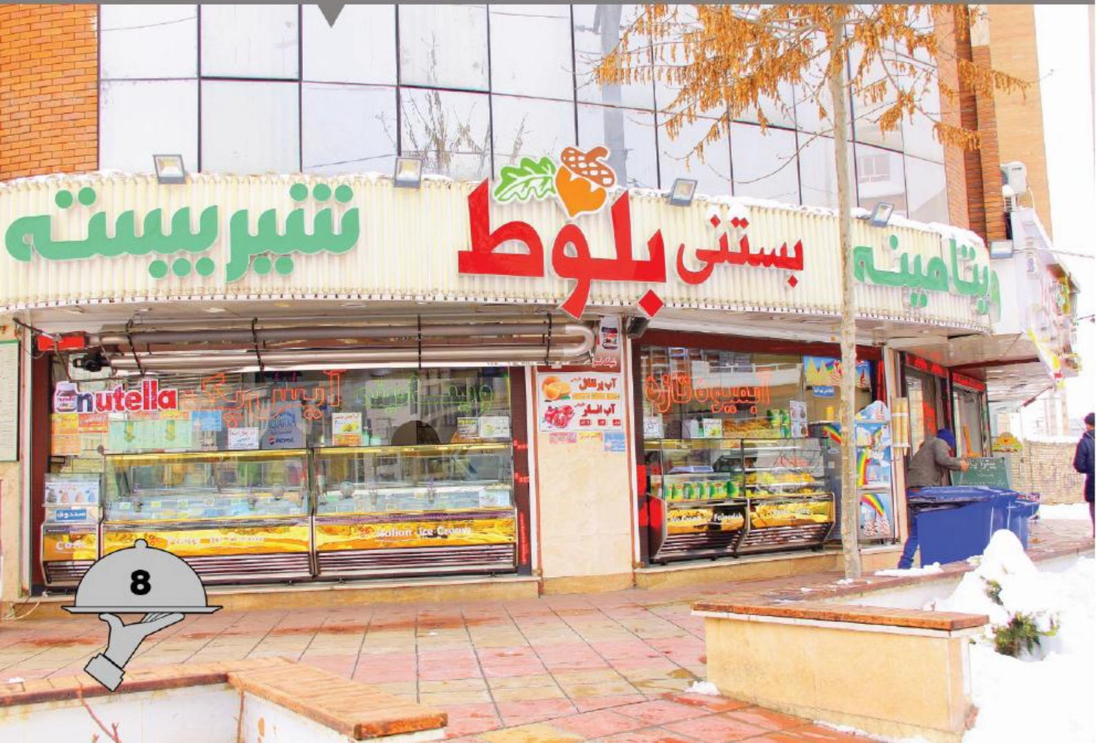
بستنی بلوط (گلشهر کرج)