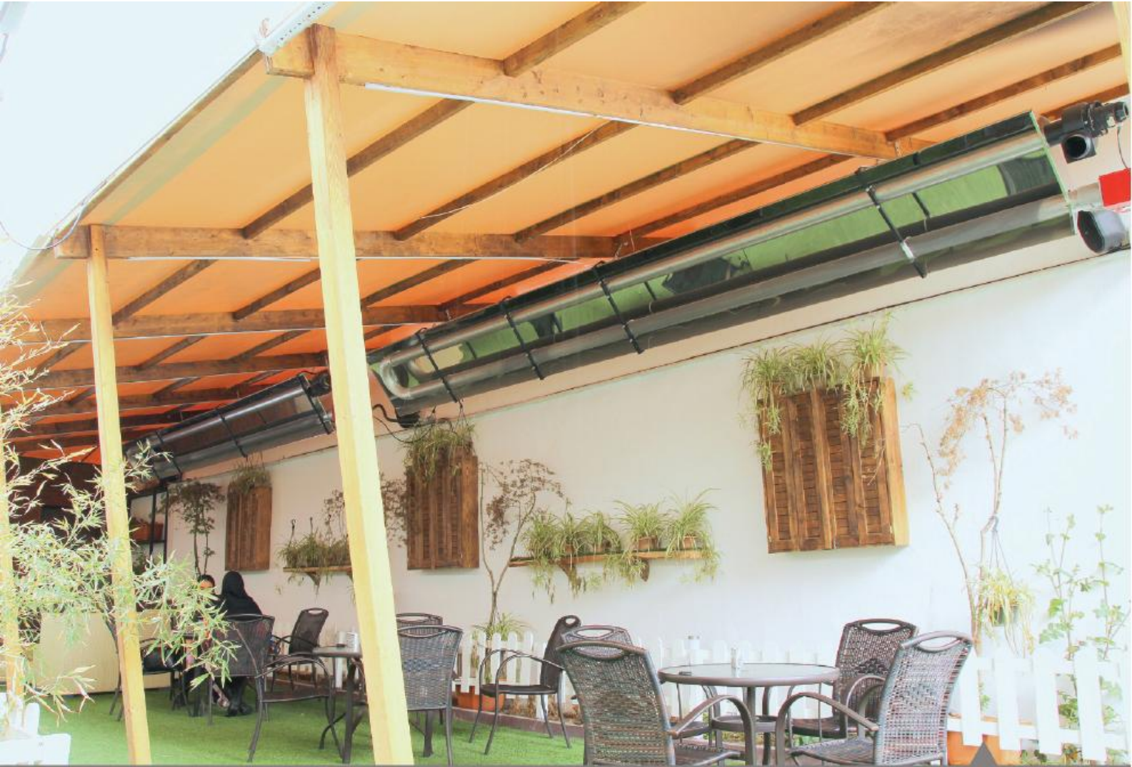
بستنی ژلاتو فکتوری (عظیمه کرج)