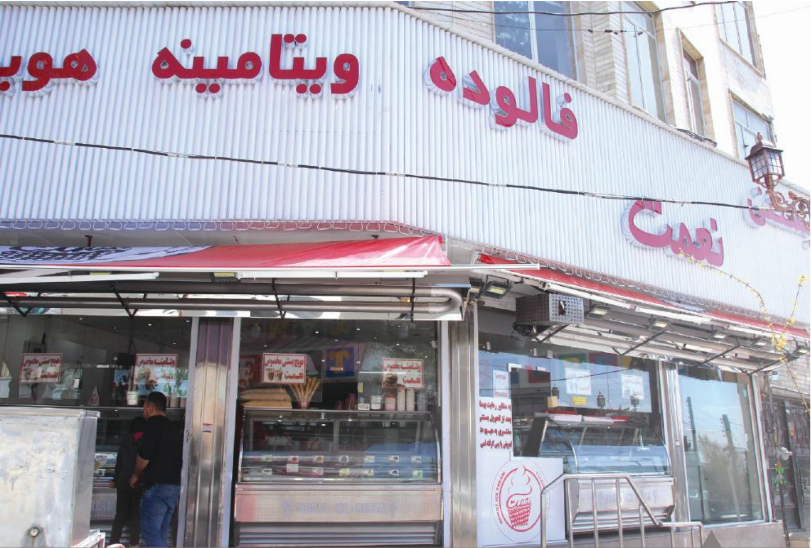
بستنی نعمت (گوهر دشت کراچ)