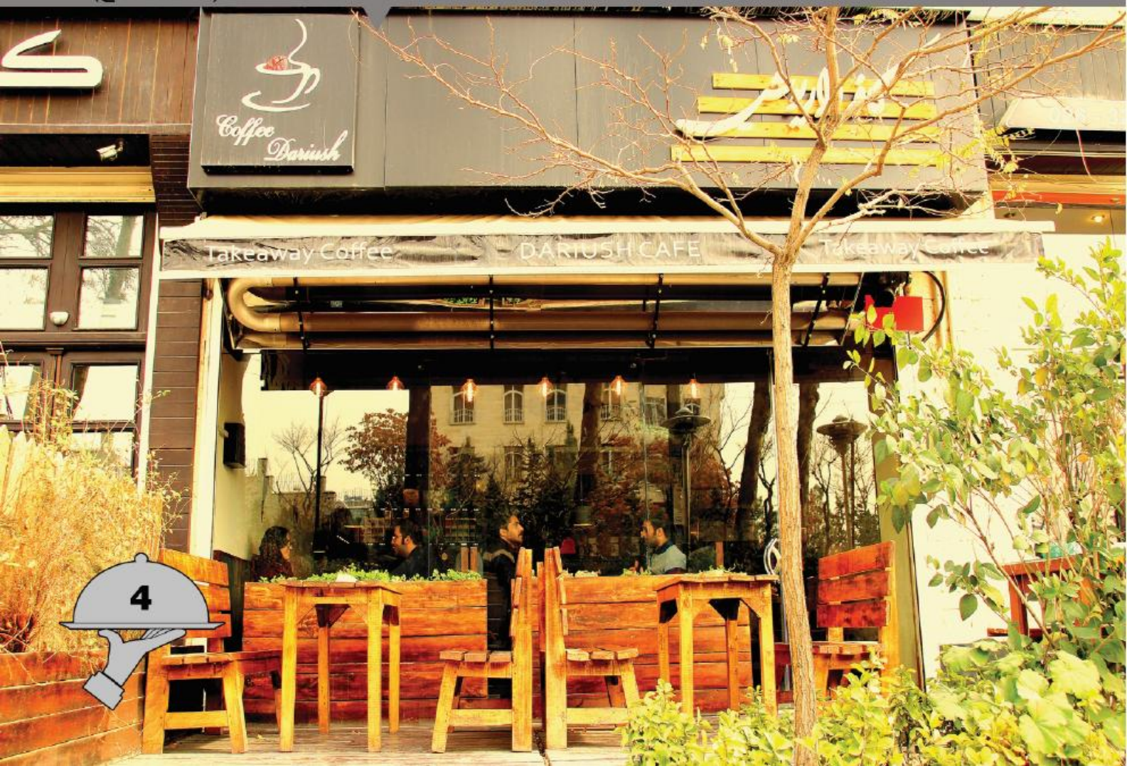
کافه داریوش (عظیمیه کرج)