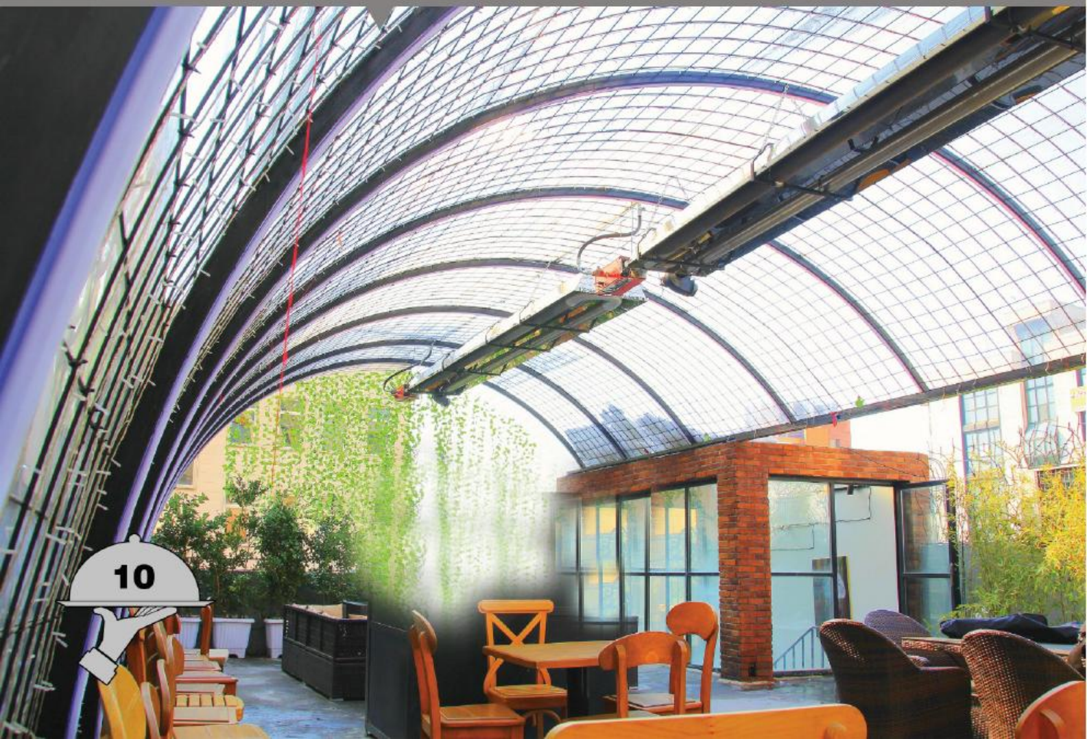
اربن کافه (سعادت آباد تهران)